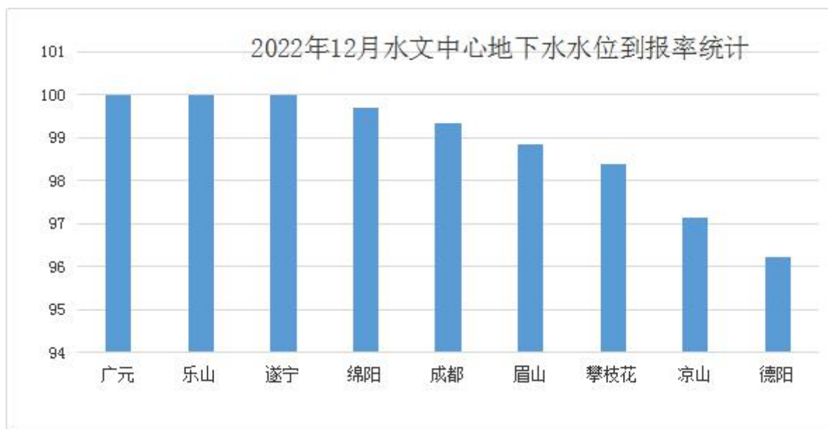
图2: 各水文中心12月地下水监测数据到报率柱状图