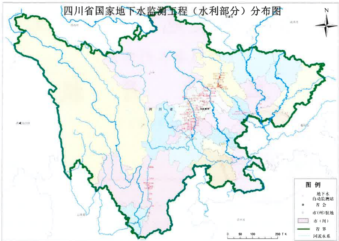
图1 国家地下水监测工程（四川省水利部分）分布图

水位：本月水位自动监测的数据到报率为99.7%，比3月相比持平。全省广元、遂宁、眉山和成都局到报率为100%，凉山、攀枝花到报率下降，乐山和德阳局到报率上升。4月份全省对9测站进行了13次维修。到报率情况见表2和图2到表3和图3。