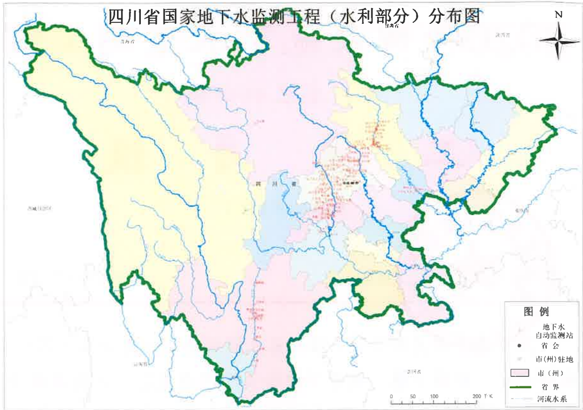
图1 国家地下水监测工程（四川省水利部分）分布图

水位：本月水位自动监测的数据到报率为99.4%，比1月相比略有下降。除眉山局略上升外，乐山局下降明显，由99.8%下降到83.9%，其余各局基本与1月持平。2月份全省对4测站进行了5次维修。到报率情况见表2和图2到表3和图3。