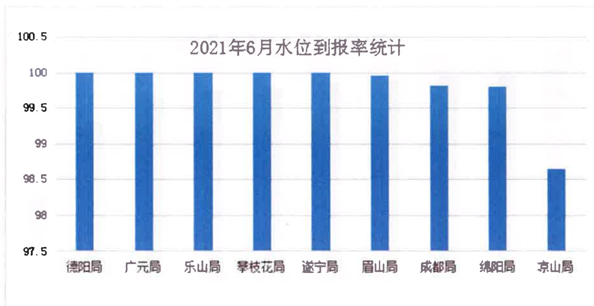
图2：各地区水文局6月地下水监测数据到报率柱状图