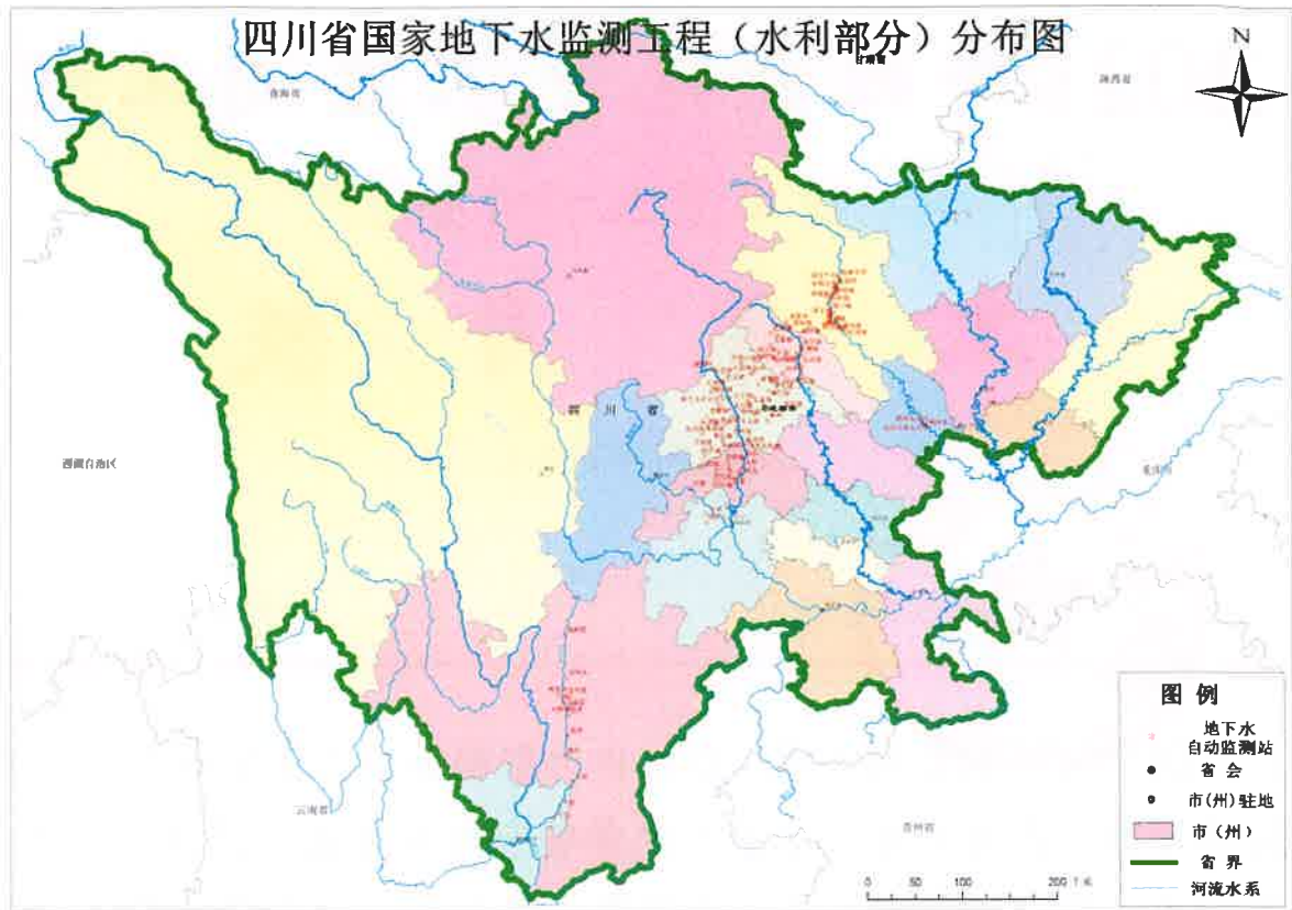
图1 国家地下水监测工程（四川省水利部分）分布图

水位：本月水位自动监测的数据到报率为99.8%，比5月相比上升。全省德阳、广元、乐山、攀枝花、遂宁、眉山到报率为100%，绵阳局和凉山局到报率下降，成都局和眉山局上升。6月份全省对3测站进行了维修，对80站进行了校测工作。到报率情况见表2和图2到表3和图3。