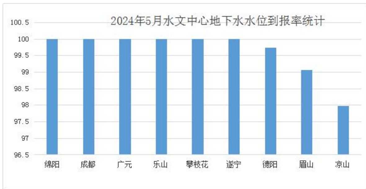
图2 各水文中心5月地下水水位到报率柱状图