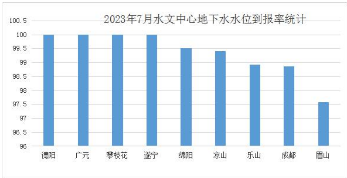
图2：各水文中心7月地下水水位到报率柱状图