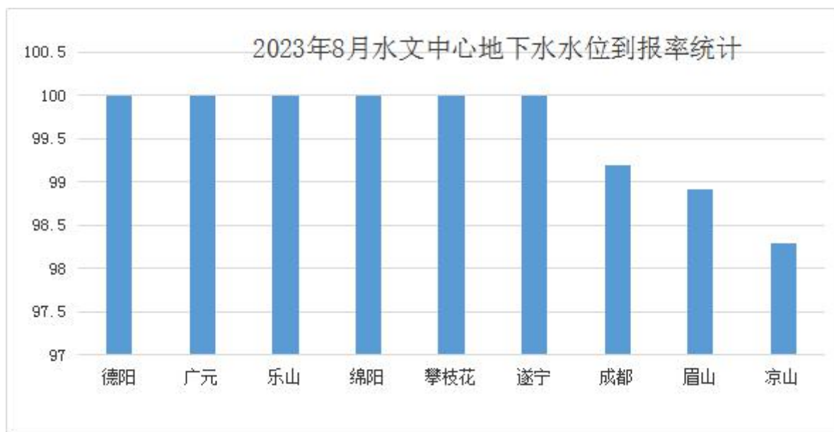
图2：各水文中心8月地下水水位到报率柱状图