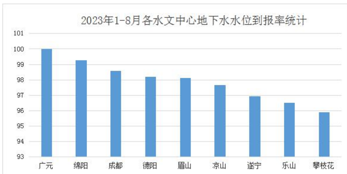
图3：各水文中心1-8月地下水水位到报率柱状图