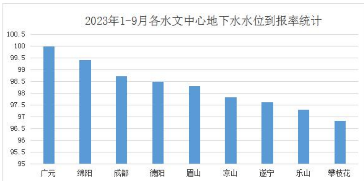
图3：各水文中心1-9月地下水水位到报率柱状图